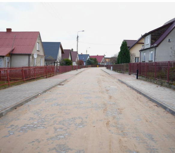
Odnowiona ulica Szkolna w Supraślu

Supraskie ulice zyskają nowy wygląd. Posterunkowa i Szkolna są budowane w ramach zadania „Budowa wraz z rozbudową i przebudową infrastruktury drogowej i technicznej na terenie Gminy Supraśl” finansowanego z rządowego programu Polski Ład.