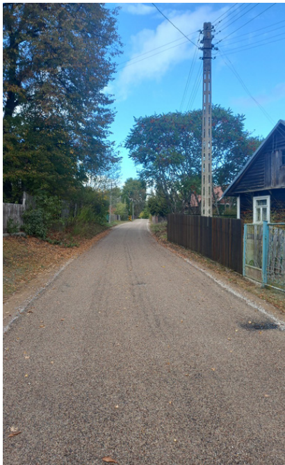
Odnowiona droga w Zubkach

Po gminie Gródek jeździmy wygodniej. Remont przeszły drogi gminne we wsiach Zubki i Grzybowce. Trwa przebudowa ulicy Fabrycznej w Gródku.